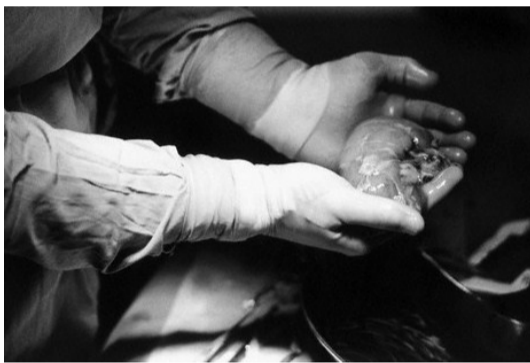
En nyre

Du kan blive organdonor, når du er fyldt 18 år. Hvis du gerne vil være organdonor, kan du enten melde dig til over internettet eller sende en folder ind til Rigshospitalet, som man kan finde hos lægen. Der står i loven at man ikke må fjerne organer fra døde, medmindre der er et tydeligt ja, fra enten familie eller afdøde. Er der nogen, der ikke kan tåle tanken om organudtagning, tages der oftest hensyn, og den finder derfor ikke sted.