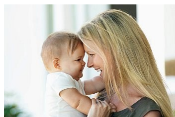
Plejebarn og plejemor

Mange børn har problemer derhjemme med deres forældre. Derfor håndterer kommunen det med, at hvis man fx gerne vil være plejeforældre, skal man igennem mange undersøgelser for at se om man er egnet til jobbet.