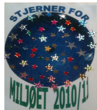
Et af skiltene, der viser elevernes arbejde for miljøet

"Vi skal passe på miljøet, sortere vores skrald og genbruge gamle ting.