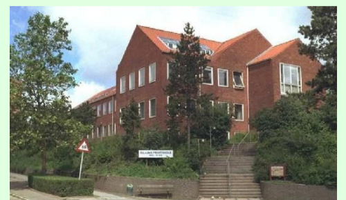
Billums Privatskole / Foto: Keld Andersen

Buddingevej 6 · 2800 Kongens Lyngby · Tlf.: 45 87 35 15